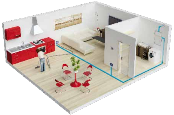
Esempio installazione centrale QB ad INCASSO Example of a BUILT-IN QB central unit installation Exemple d'installation centrale QB ENCASTRABLE Installationsbeispiel Zentralgerät QB zum EINBAU Ejemplo de instalación de central QB INTEGRADA Exemplo de instalação central QB de ENCASTRE

TUBÒ è un sistema aspirapolvere centralizzato composto da tubi a pavimento, prese a parete e da una centrale aspirante situata in un locale separato, verso la quale sono convogliate le polveri aspirate, evitando il ricircolo di batteri nell'aria.